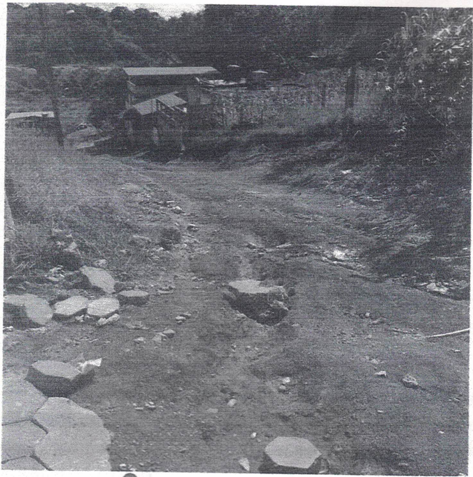
📍 Bairro chácara