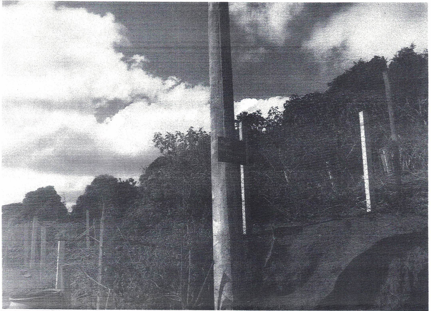
Rua Irene de Lourdos.